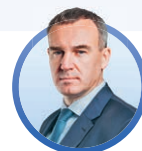
Сопредседатель ВАРМСУ, глава города Тюмени Руслан КУХАРУК:

Наработанный нами опыт, практика важны прежде всего для коллег, работающих в органах управления новых субъектов РФ. Разработанные Правительством РФ механизмы поддержки, такие, как инфраструктурные кредиты, национальные проекты, строительство объектов для социальной сферы, расселение из аварийного жилья, строительство дорог, позволяют главам городов активно, на качественно более высоком уровне решать вопросы местного значения.